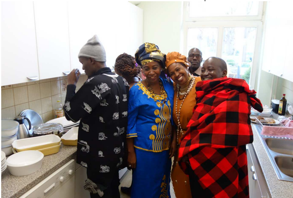
14. April 2016, Gemeindehausküche: Die Reisegruppe bereitet die Bewirtung beim Info- Abend vor

Finanziell möglich gemacht wurde diese Begegnung durch den Kirchlichen Entwicklungsdienst (KED), der über 5.000 € an Flugkosten getragen hat, die BINGO!-Lotterie des Landes, die 1.750 € beigesteuert hat, und die AWO Münsterdorf, die die Buskosten für zwei Ausflüge in Höhe von 820 € übernommen hat.