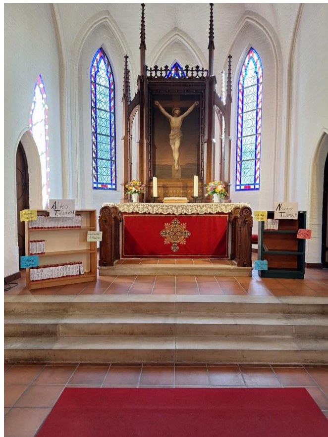
Im Bild links die Arbeitsphase: Die Bücher der Bibel, aufgeteilt nach Altem und Neuem Testament. Rechts dann die Präsentation im Altarraum zum Gottesdienst.