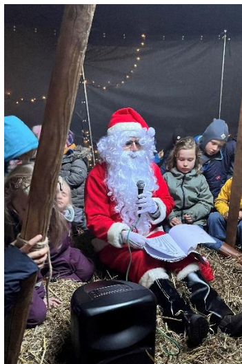
Der Weihnachtsmann liest vor