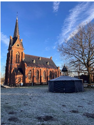
Vorweihnachtliche Stimmung auf dem Kirchplatz vor dem Markt